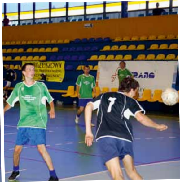
➤ Jubileuszowy turniej rozegrany został w przyjacielskiej atmosferze. Tego dnia wszyscy dobrze się bawili.