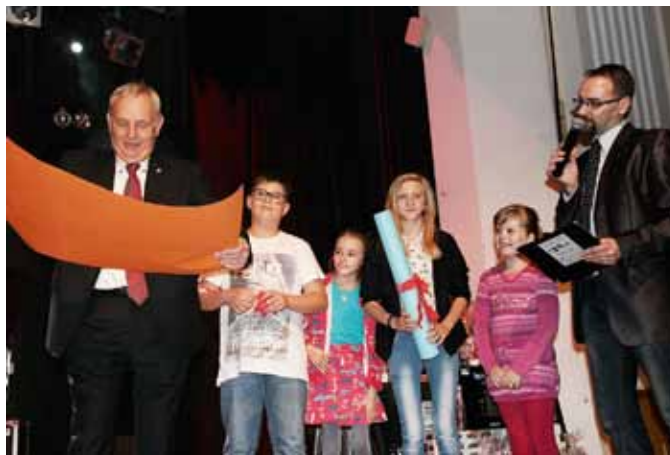
Dzieci wręczyły Prezesowi rysunki przedstawiające Spółdzielnię.