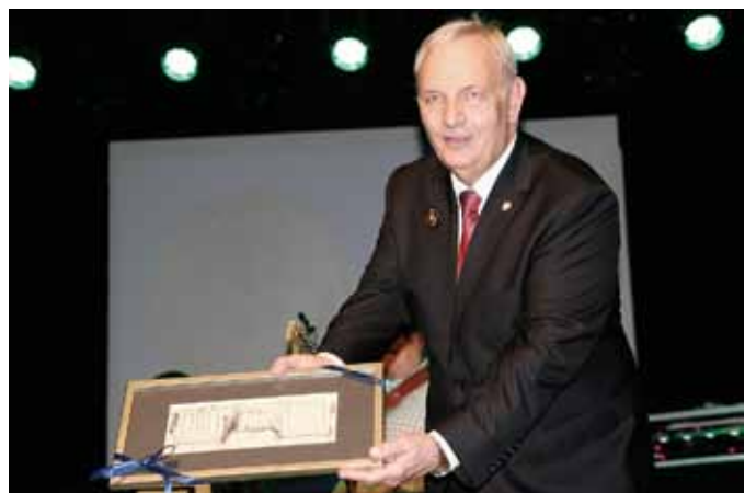
Prezes przedstawia uczestnikom otrzymaną grafikę Urzędu Wojewódzkiego.