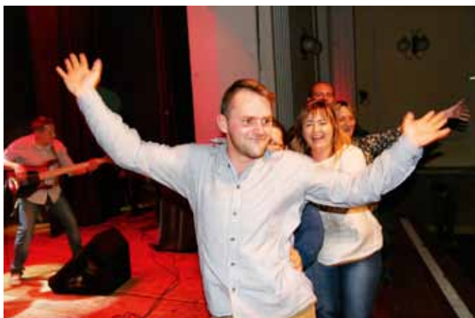
Zabawa była bardzo udana...

Dorośli również bawili się znakomicie. Do tanecznej zabawy