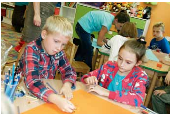
Na dzieci czekały liczne gry i zabawy.