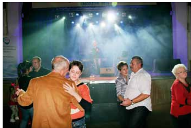
...i potrwała do wieczora.